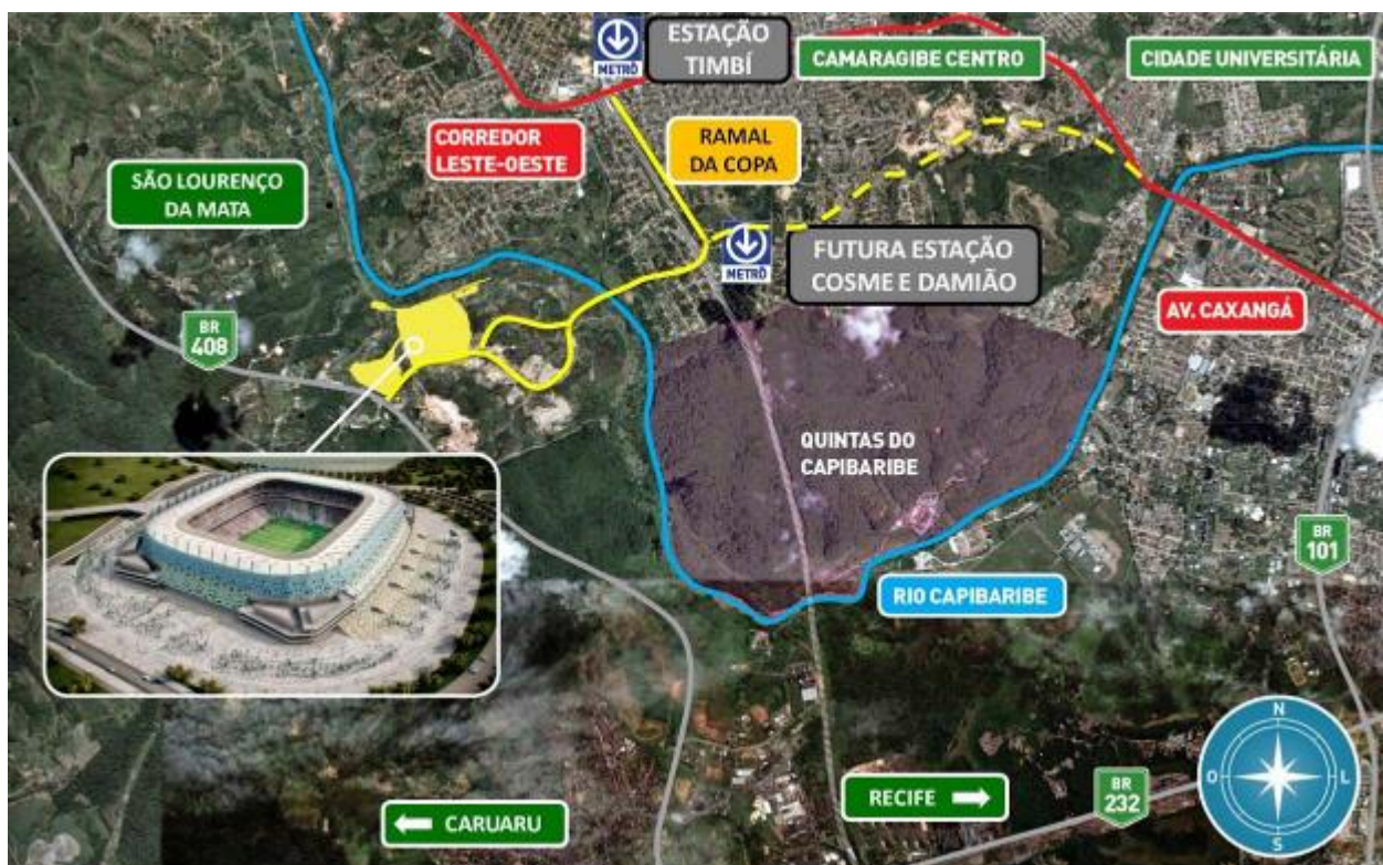
Figura 1. Mapa de localização do empreendimento.

A Arena Pernambuco está localizada a 19 km do Marco Zero do Recife e do Aeroporto dos Guararapes e a 03 km do Terminal Integrado de Passageiros (TIP). O empreendimento está situado às margens da Rodovia BR-408, no Município de São Lourenço da Mata, na Região Metropolitana de Recife, Pernambuco, conforme Figura 1 a seguir.